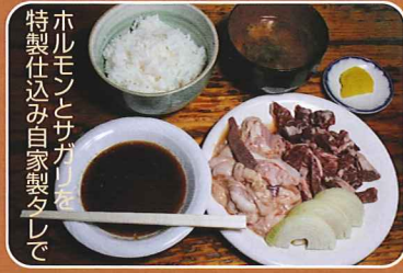
ホルモンとサガリを 特製仕込み自家製タレで ●サフォークあいランド ☎29-2352 (提供)11:30~14:00不定休 五郎のスタミナ定食 1,000円