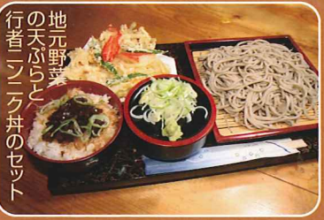
地元野菜 の天ぷらと 行者ニンニク丼のセット ●麓郷デパート夫婦食堂 ☎29-2020 (提供)10:30~18:00 五郎の好物セット 1,100円