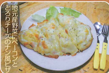
地元産野菜にベーコンと とろりチーズのナン風ピザ

●カフェレストランかりん ☎22-1692 提供 11:00~20:00・不定休 「北の国から」五郎の山菜チーズラーメン 1000円