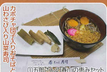
カボチャ団子入りおそばと 山わさび入り山菜寿司 ①五郎さんの春山の恵みセット ●春ちゃん寿司 ☎22-3235 (提供)11:00~14:00 ①五郎さんの春山の恵みセット 780円 ②純と蛭の雪山セット 880円