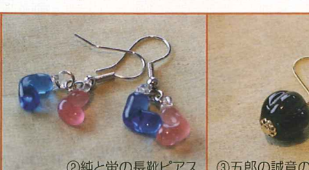
②純と蛍の長靴ピアス