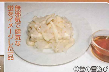
無邪気で健気な 蛍をイメージした品

●富良野料飲店組合「北の国から」30周年メニュー提供店(28店舗) 提供 各店舗営業時間 ③五郎のきき酒セット(男山、高砂、千歳鶴五郎愛飲の道産酒三種) 2,000円 ①五郎の泥水 600円 ②純の夜遊び 600円 ③蛍の雪遊び 500円