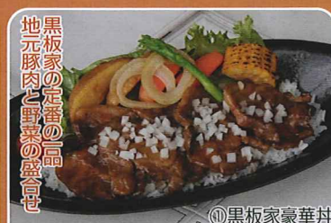
黒板家の定番の高級 地元豚肉と野菜の盛合せ ①黒板家豪華丼 ●ハイランドふらの ☎22-5700 (提供)11:30~15:00 ①黒板家豪華丼 1,050円 ②「北の国から」あか乳ラーメン 950円