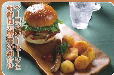
新鮮地元産野菜の組合せ ベーコンソーセージと

●麓郷の森 ☎29-2323 提供 9:00~17:00 「北の国から」麓郷の森 玉ねぎキッシュ セット 600円/単品 360円