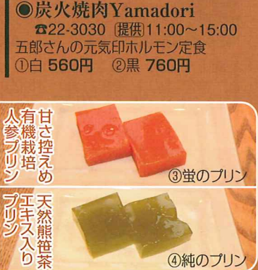
甘さ控えめ 有機栽培 人参プリン ③蛭のプリン 天然熊笹茶 エキス入り プリン ④純のプリン