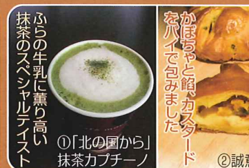
ふらの牛乳に薫り高い 抹茶のスペシャルティースト

●くんえん工房 Yamadori ☎39-1810 提供 11:00~15:00 純のおねだりホットドッグ セット 500円/単品 320円