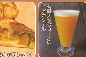
有機人参ジュースの ピアカクテル

●フラノ・マルシェ ☎22-1001 提供 10:00~18:30 ①「北の国から」抹茶カプチーノ 400円 ②誠意のかぼちゃパイ 320円 ※数量限定品