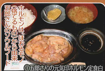
ホルモンはほめるモノ を捨てるものから出来 五郎さんのソウルフード ①五郎さんの元気印ホルモン定食白 ●炭火焼肉 Yamadori ☎22-3030 (提供)11:00~15:00 五郎さんの元気印ホルモン定食 ①白 560円 ②黒 760円