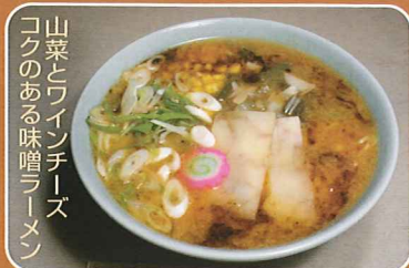
山菜とワインチーズ コクのある味噌ラーメン

●カフェレストランかりん ☎22-1692 提供 11:00~20:00・不定休 「北の国から」五郎の山菜チーズラーメン 1000円