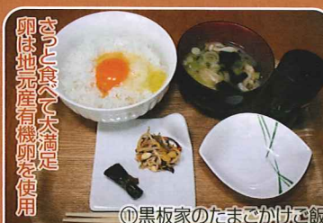
さつと食べて大満足 卵は地元産有機卵を使用 ①黒板家のたまごかけご飯 ●富良野ナチュラルホテル ☎22-1777 (提供)11:30~14:30 ①黒板家のたまごかけご飯 560円 ②ここみのピクニックランチ 950円