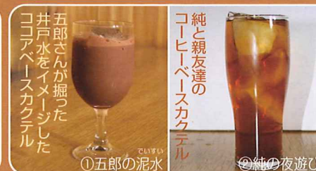
五郎さんが掘った 井戸水をイメージした ココアベースカクテル

●ミュージックパブ・ミカド ☎23-3371 提供 18:00~23:30 五郎の好きな春の恵み 500円