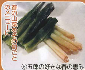
春の山菜をその旬で のメニューに

●まさ屋 ☎23-4464 提供 15:00~22:30 五郎の人参ビール 600円