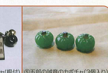
⑤五郎の誠意のカボチャ(3個入り)

●グラスフォレスト in 富良野 ☎39-9088 提供 9:00~18:00 ①石の家コップ 2,625円 ②純と蛍の長靴ピアス 1,680円 ③五郎の誠意のカボチャ(ピアス) 1,050円 ④五郎の誠意のカボチャ(根付) 892円 ⑤五郎の誠意のカボチャ(1個入り) 525円/(3個入り) 1,365円/(6個入り) 2,625円