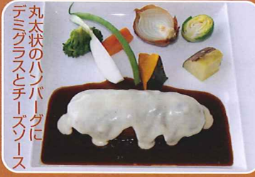
丸太状のハンバーグに デミグラスとチーズソース ●ふらのワインハウス ☎23-4155 (提供)11:00~20:30 「北の国から」丸太ハンバーグ 旬の温野菜添え 1,200円

期間限定 特別メニュー 富良野市内45店舗にて ご提供しています ※うら面もご覧下さい