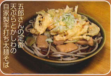
五郎さんの定番 天ぷらとかしわの 自家製手打ち太麺そば ●小野田そば ☎29-2662 (提供)11:00~14:30 五郎の定番 900円