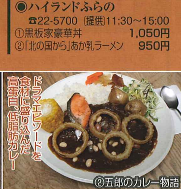
ドラマエピソードを 食材に盛り込んだ 高蛋白・低脂肪カレー ②五郎のカレー物語