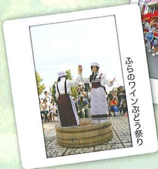
ふらのワインまつり